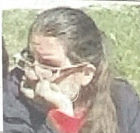
a pag. 30

Formigine I ladri portano via la cassaforte con soldi e gioielli