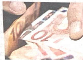
► Monselesan a pag. 6 e 7

Previdenza Inps, a dicembre le pensioni saranno più pesanti