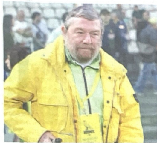
► Panini a pag. 37

Calcio Serie B I conti del Modena: tra investimenti e costi dei giocatori