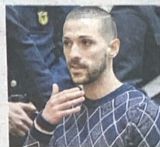
a pag. 4

La sentenza Impagnatiello condannato all'ergastolo